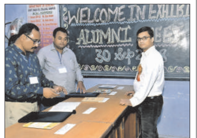
पुरातन छात्र सम्मेलन में प्रदर्शनी का दृश्य