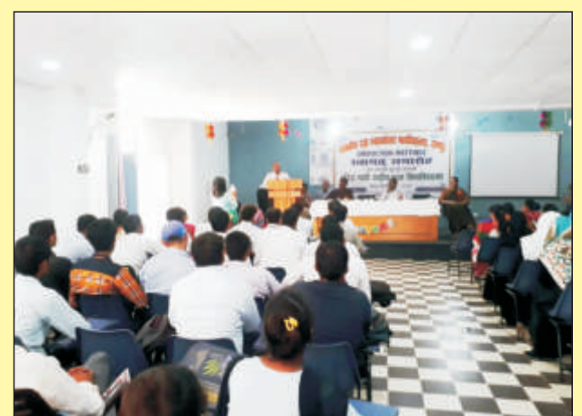
इग्नू इंडक्शन मीटिंग का दृश्य