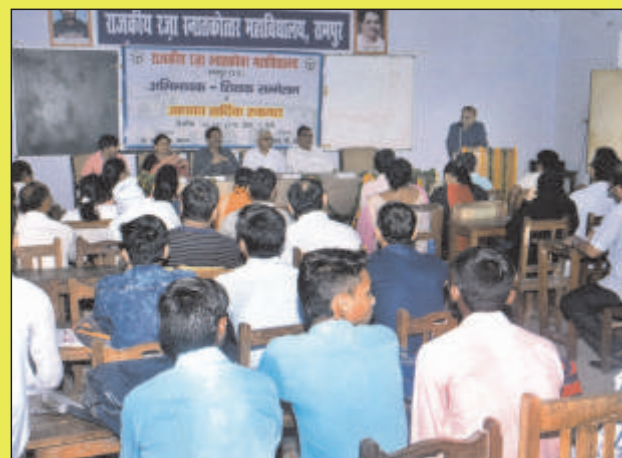
अभिभावक-शिक्षक सम्मेलन का दृश्य