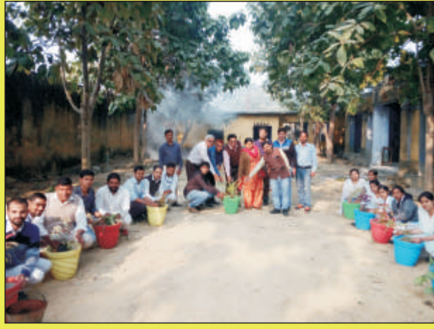
वृक्षारोपण करते हुए बी.एड. के छात्र-छात्राएं