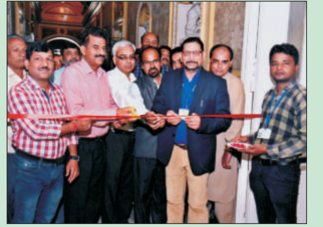
सरदार पटेल जयन्ती पर रन फॉर यूनिटी प्रदर्शनी का रज़ा लाइब्रेरी रामपुर में उद्घाटन करते प्राचार्य