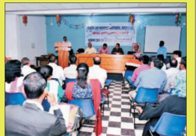
पुरातन छात्र परिषद के गठन का दृश्य