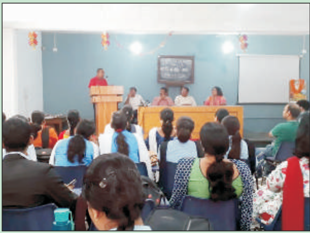
वाल्मीकि जयन्ती का दृश्य