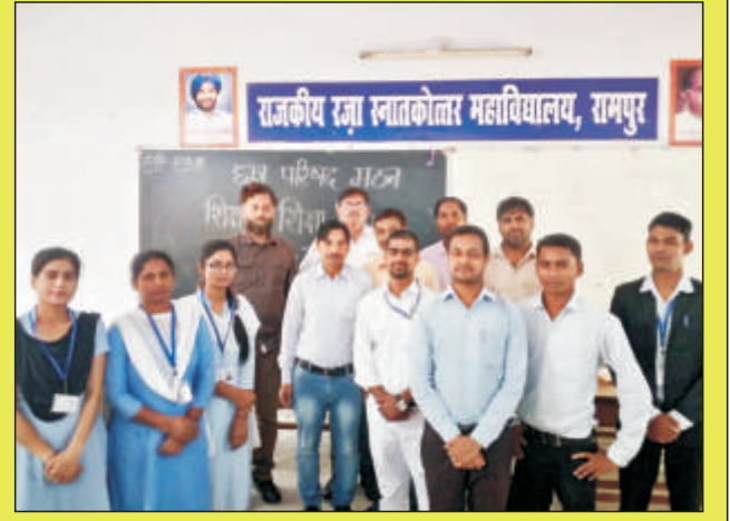
बी.एड. विभागीय परिषद के पदाधिकारीगण