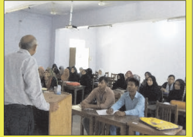
अतिथि व्याख्यान का दृश्य