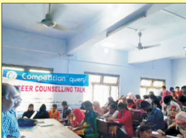
कम्पीटीशन क्वेरी एवं कैरियर काउंसिलिंग का दृश्य