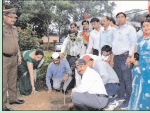
कारगिल विजय में शामिल भूतपूर्व सैनिकों एवं उनके परिजनों के साथ वृक्षारोपण करते प्राचार्य