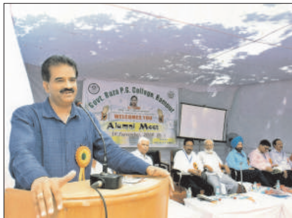
सम्मेलन को संबोधित करते प्राचार्य