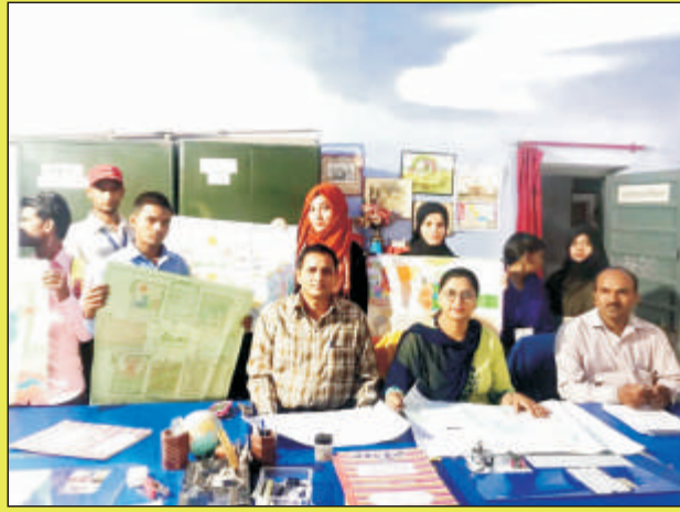
अर्थशास्त्र विभागीय परिषद की गतिविधियाँ