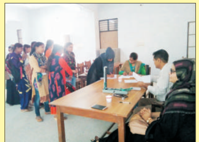
महाविद्यालय में आयोजित स्वास्थ्य शिविर का दृश्य