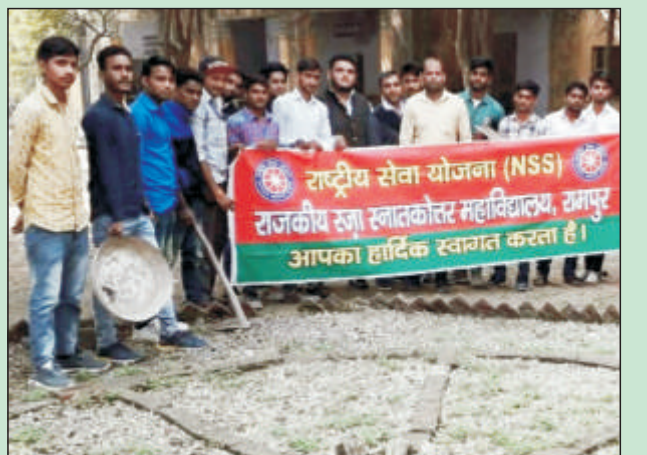
महाविद्यालय में स्वच्छता अभियान चलाते एन.एस.एस. के स्वयंसेवक