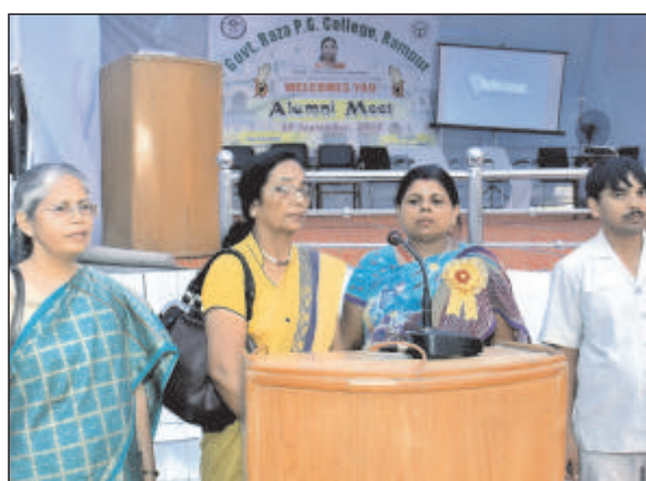
राष्ट्रगान के साथ समापन का दृश्य