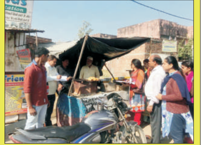
आर्थिक सर्वेक्षण एवं स्वास्थ्य जागरूकता अभियान चलाते महाविद्यालय के अर्थशास्त्र विभाग के प्राध्यापकगण