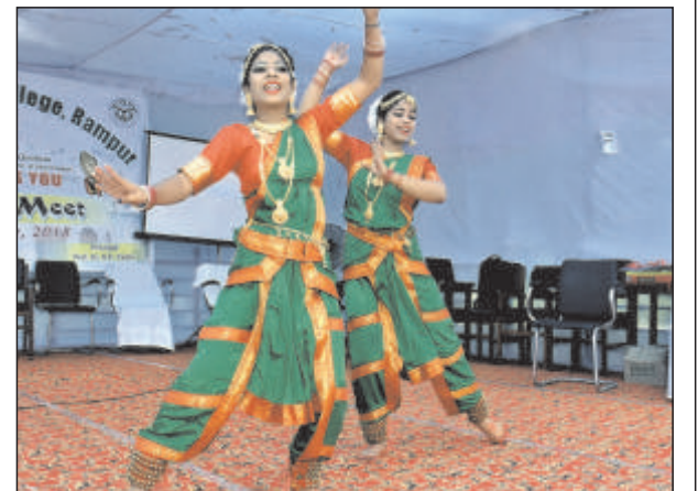
सांस्कृतिक कार्यक्रम प्रस्तुत करती छात्राएं