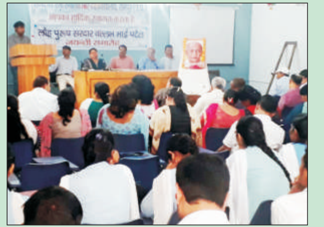
लौह पुरुष सरदार बल्लभ भाई पटेल जयन्ती (राष्ट्रीय एकता दिवस) का दृश्य