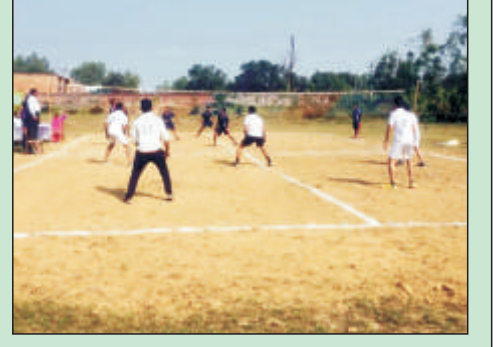
एक्शन में महाविद्यालय की बॉल बैडमिंटन टीम