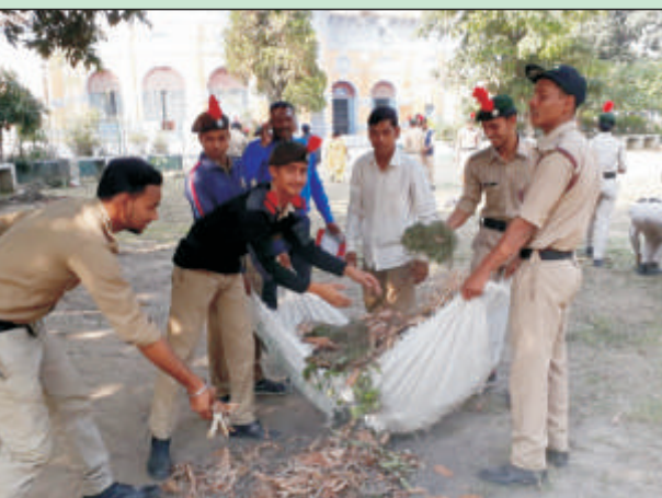
स्वच्छता अभियान में श्रमदान करते हुए एन.सी.सी. के डेडेट्स