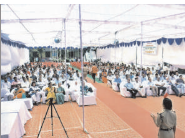
उपस्थित पुरातन छात्र-छात्राएं