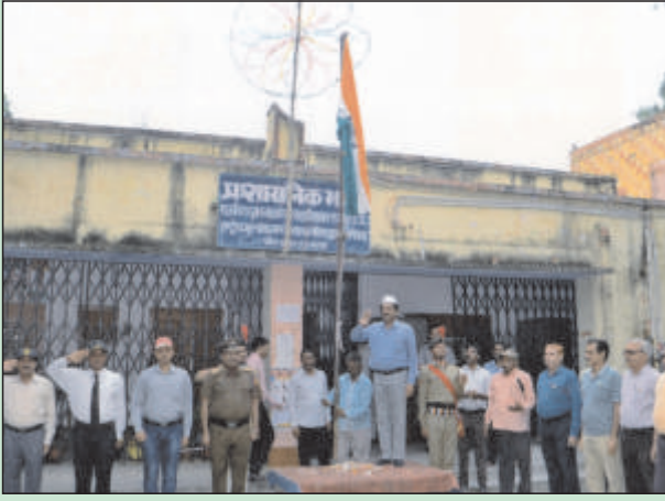
स्वतंत्रता दिवस के अवसर पर ध्वजारोहण करते प्राचार्य