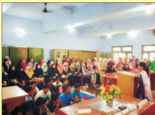
विज्ञान संकाय (ZBC) का ओरियन्टेशन कार्यक्रम का दृश्य