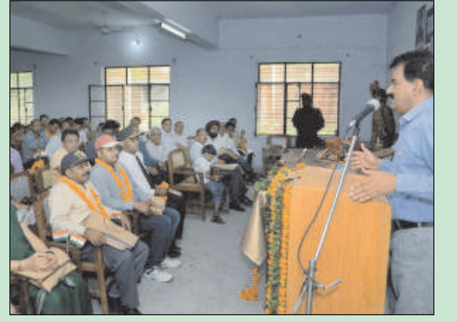
कारगिल विजय में शामिल सैनिकों एवं शहीद सैनिकों के परिजनों को सम्मानित करते प्राचार्य