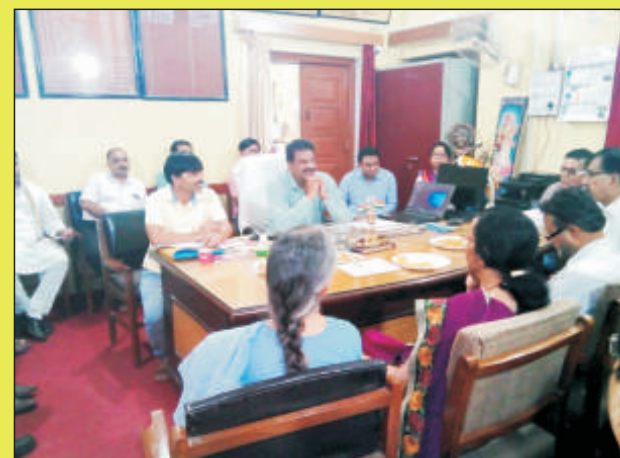
पुरातन छात्र एवं छात्राओं की बैठक का दृश्य