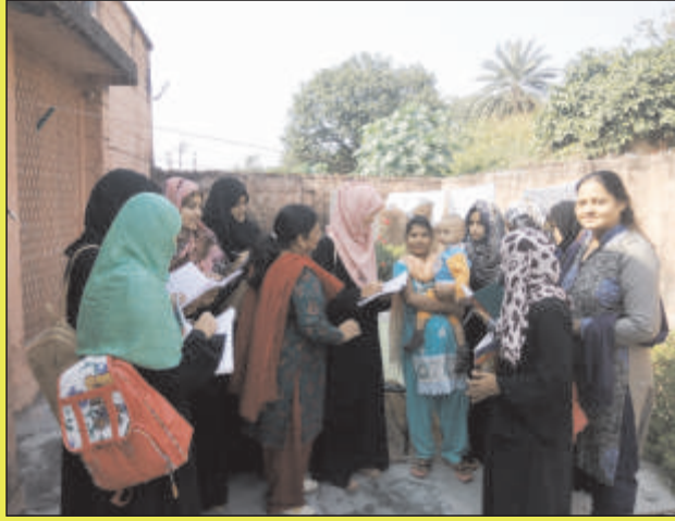
स्वास्थ्य सर्वेक्षण करती महाविद्यालय के मनोविज्ञान विभाग की प्राध्यापिकायें एवं छात्राएं