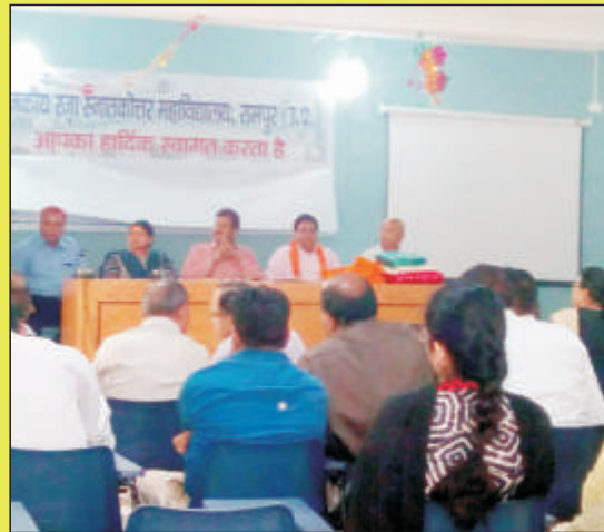
आदेश विश्वादी की सेवानिवृत्ति समारोह का दृश्य