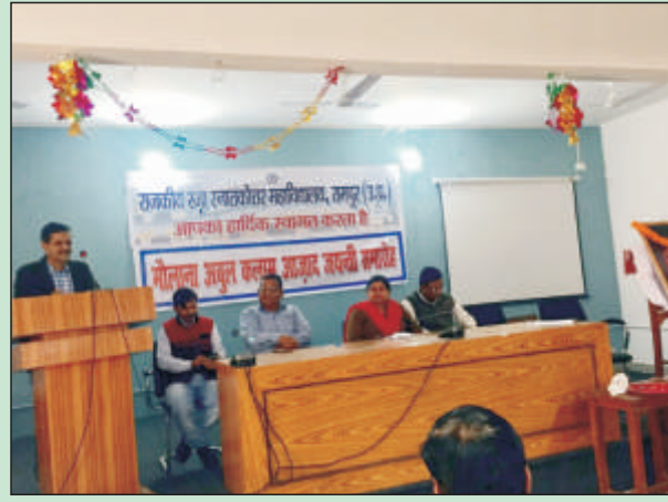
मौलाना अबुल कलाम आज़ाद जयन्ती (राष्ट्रीय शिक्षा दिवस) समारोह का दृश्य