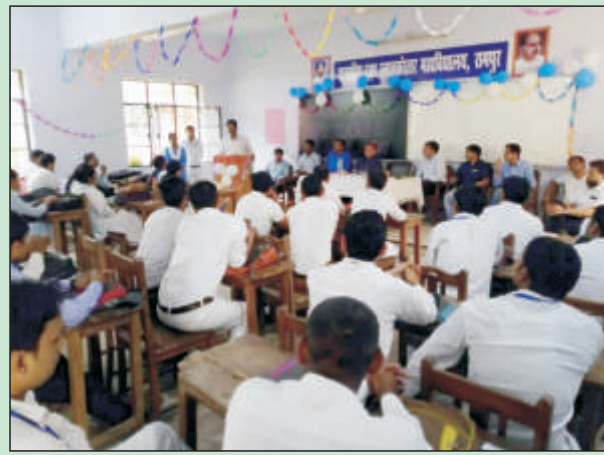
बी.एड. विभाग द्वारा आयोजित शिक्षक दिवस का दृश्य