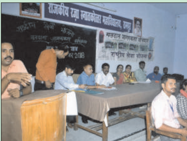
मतदाता जागरूकता अभियान के अन्तर्गत ग्राम सभा की यात्रा का अभिनय करते एन.एस.एस. प्रतिभागी